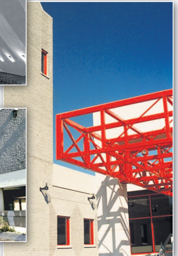
Institut national d'optique à Sainte-Foy