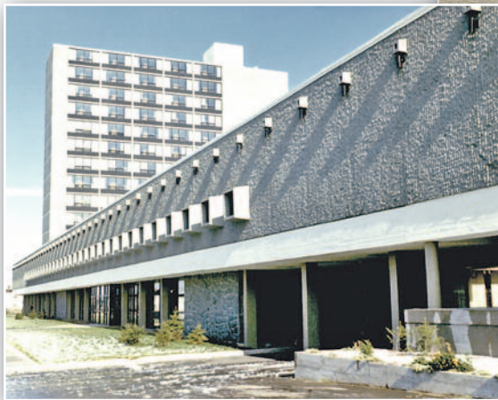
Collège de Jonquière